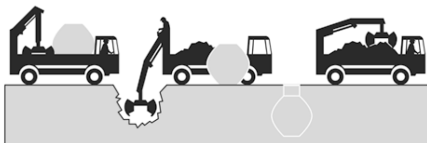
Haase kommt. Gräbt den Erdtank ein. Nimmt den Aushub mit. Fertig!

Selbst in hochwassergefährdeten Gebieten und bei hohem Grundwasserstand können Haase-Erdtanks eingelagert werden. In diesen Fällen wird der Tank mit einer kostengünstigen bauartzugehörigen Auftriebssicherung versehen.